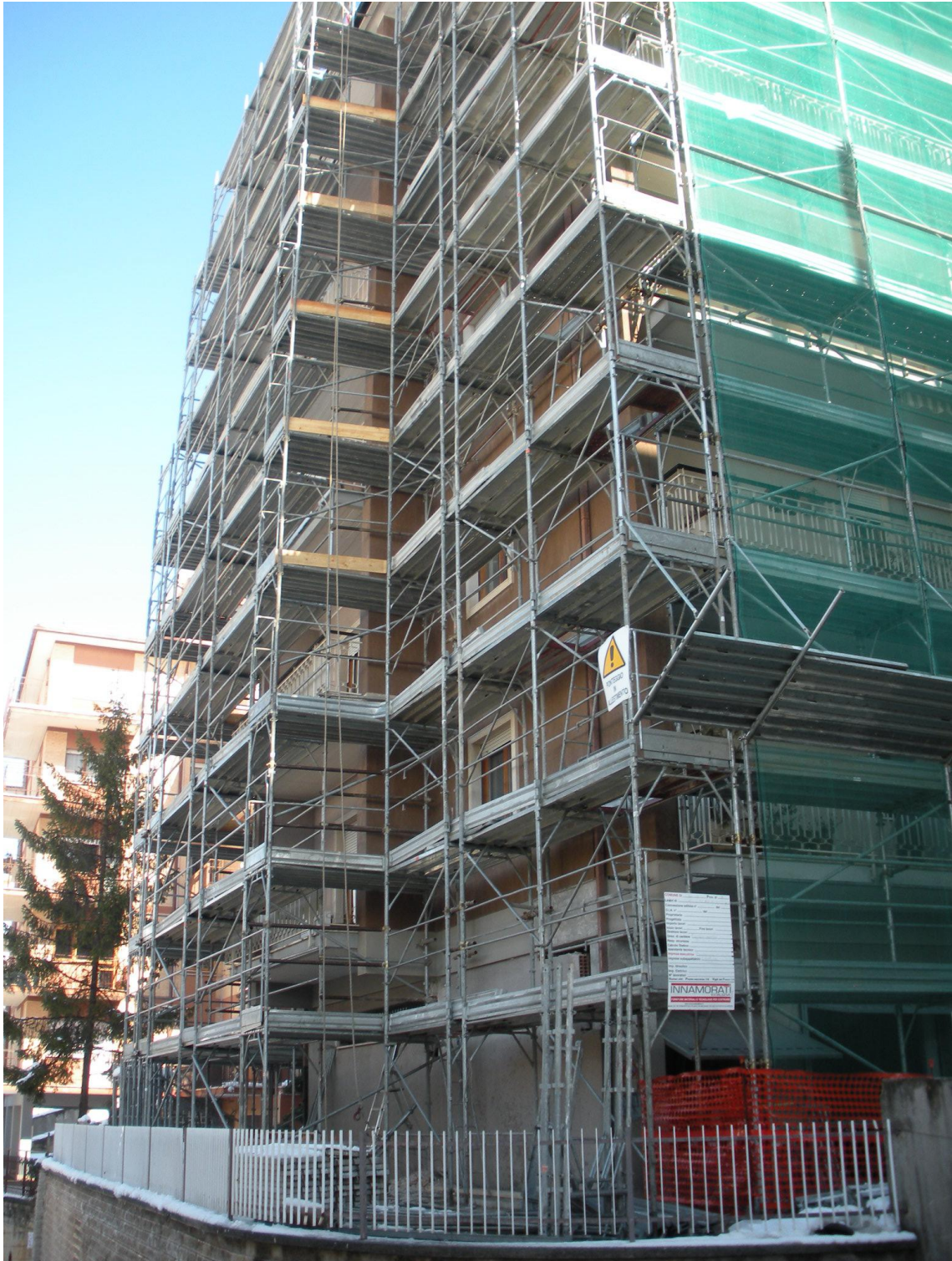
Condominio in Via Penne, 4