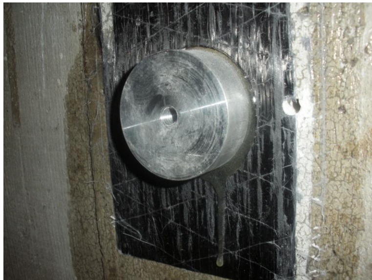
PROVE DI STRAPPO