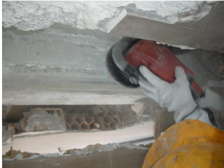
PREPARAZIONE DEL CALCESTRUZZO