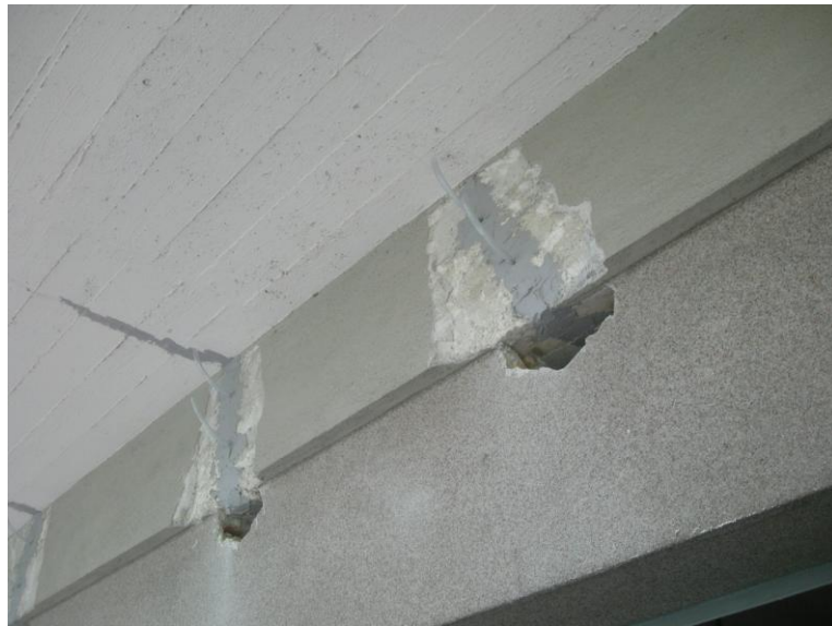
SARCITURA DELLE LESIONI CON RESINA EPOSSIDICA FLUIDA