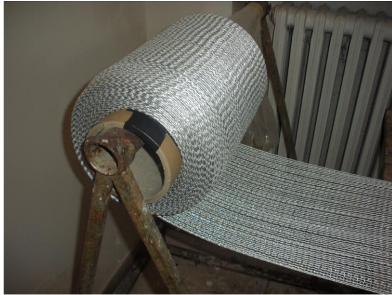
TESSUTI IN ACCIAIO